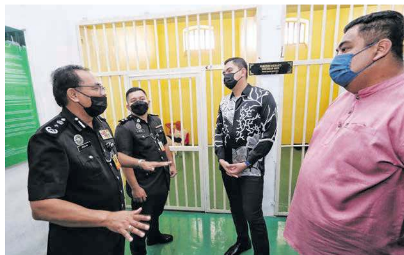
AKMAL ketika mengadakan lawatan ke bilik pameran sempena Majlis Perasmian Pameran Metamorfosis Di Sebalik Tembok di Muzium Penjara, Bandar Hilir.