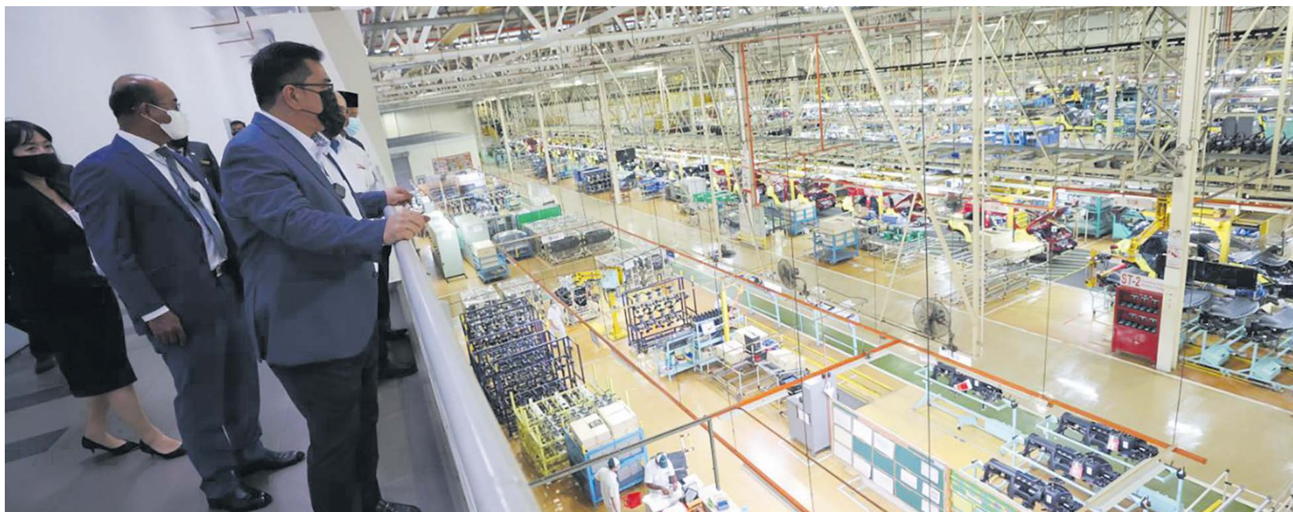
SULAIMAN melawat kilang pemasangan Honda Malaysia di Pegoh.