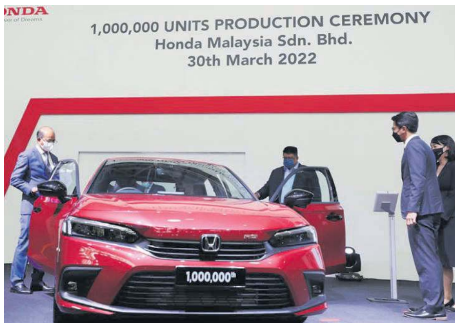
AB Rauf melihat ruangan dalaman Honda Civic ke sejuta yang dipasang Honda Malaysia di kilangnya di Pegoh.

"Kerana inilah satu-satunya kilang pemasangan kereta Honda di Malaysia yang diberikan keutamaan untuk memasang semua model baru dan akan dipasarkan untuk pasaran tempatan," katanya.