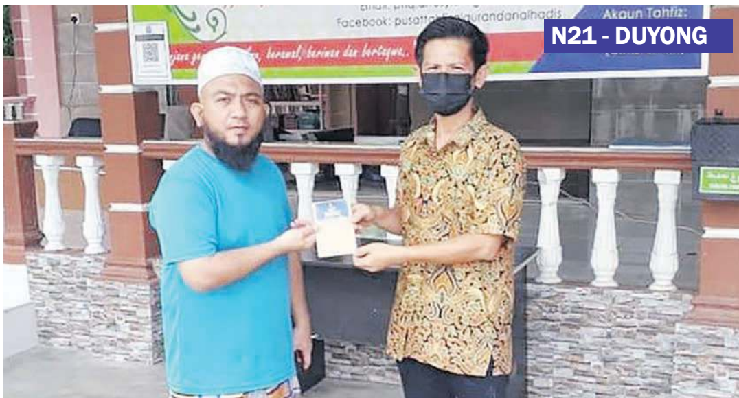
PENYAMPAIAN sumbangan kepada masjid, surau dan maahad tahfiz di sekitar DUN Duyong.