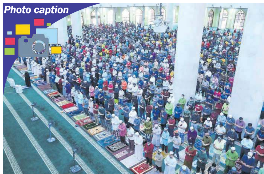
LEMBARAN BAHARU... Suasana solat Jumaat di Masjid Al-Azim, Bukit Palah dengan penjarakan satu sejadah di antara jemaah bersempena fasa peralihan ke endemik bermula 1 April lalu.