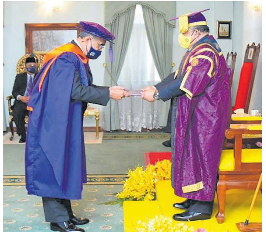
RAJA Perlis Tuanku Syed Sirajuddin Putra Jamalullail yang juga Canselor USM berkenan menyampaikan Ijazah Kehormat Doktor Ekonomi Pembangunan (Hon. D. Dev. Econs) kepada Yang di-Pertua Negeri Melaka Tun Seri Setia Dr Mohd Ali Mohd Rustam.

"Alumni USM perlu menjadi contoh untuk diikuti dan mampu melakukan perubahan dalam masyarakat di mana sahaja berada," titah baginda. - BERNAMA