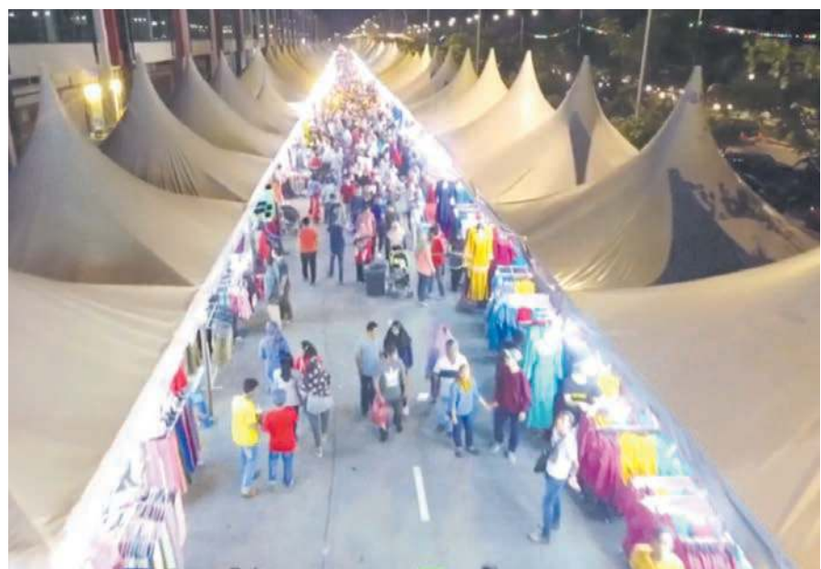
GAMBAR hiasan bazar Aidilfitri di Klebang.