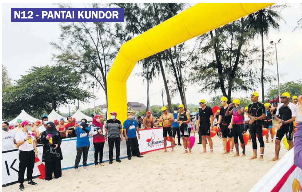
TUMINAH merasmikan 113 Aquathlon Melaka 2022 di Pentas Budaya Pantai Puteri yang membatik seramai 300 peserta dalam dan luar negara.