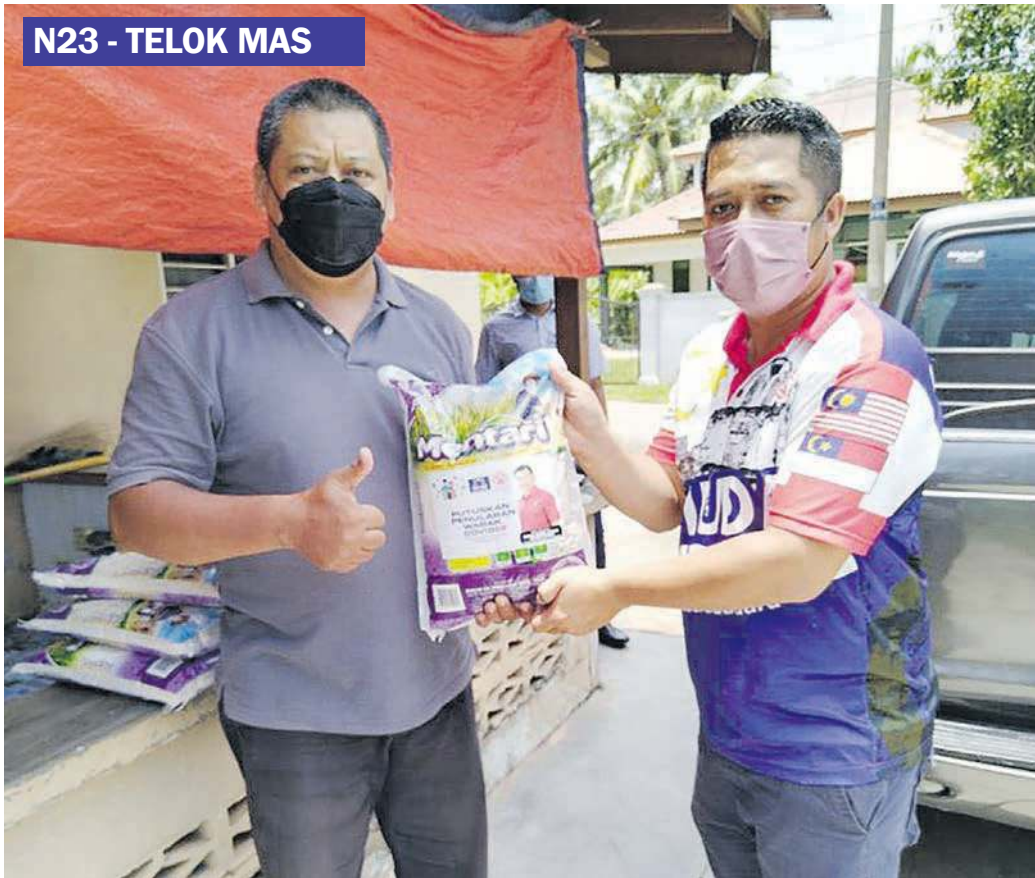
PASANGAN baharu berkahwin diberikan beras percuma 100 kilogram.