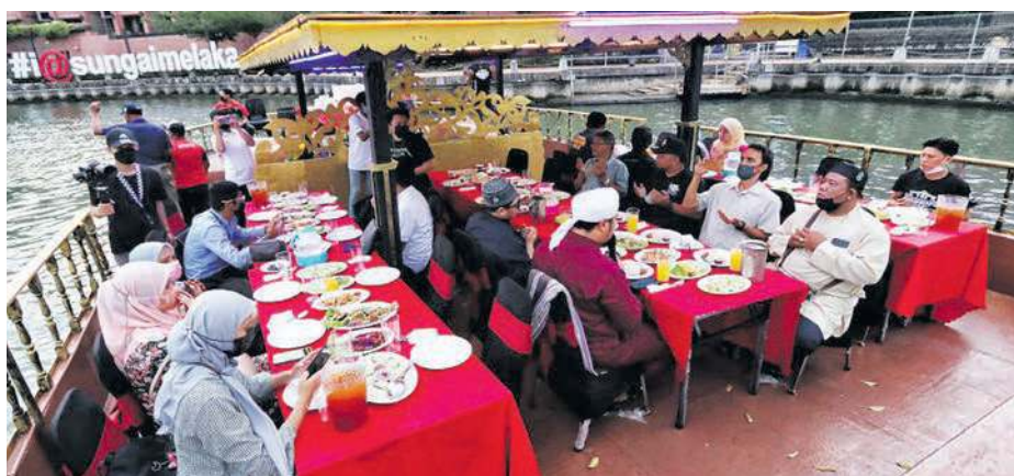
PELANGGAN menikmati hidangan sambil menyusuri keindahan Sungai Melaka diatas Kapal Mendam Berahi di Kampung Hulu, Banda Hilir.

RM640 bagi setiap meja untuk lima orang, pelanggan akan dihidangkan dengan menu utama namun mereka juga boleh menempah menu tambahan lain seperti burger, chicken chop, cendol mener-