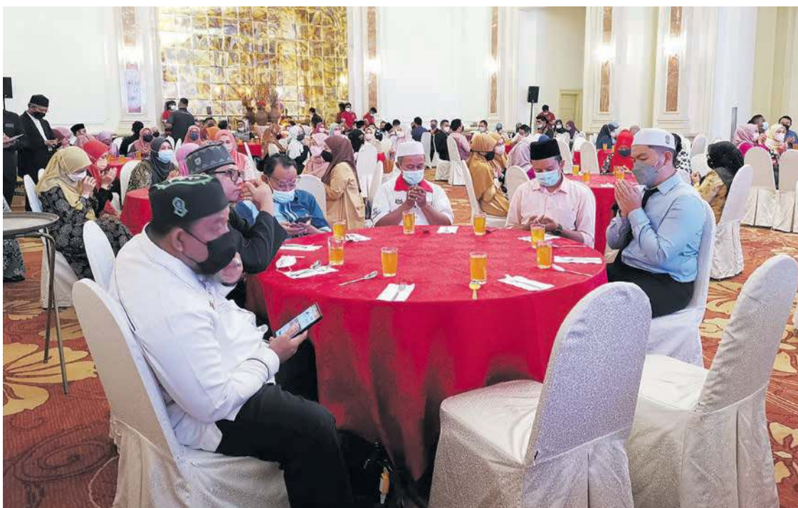
SEBAHAGIAN pegawai dan kakitangan MAIM hadir pada majlis itu.

Kerjasama antara agensi kerajaan dan pertubuhan bukan kerajaan (NGO) serta masyarakat sekeliling juga merupakan aspek penting dalam memastikan MAIM menjadi rujukan utama umat Islam di negeri ini.