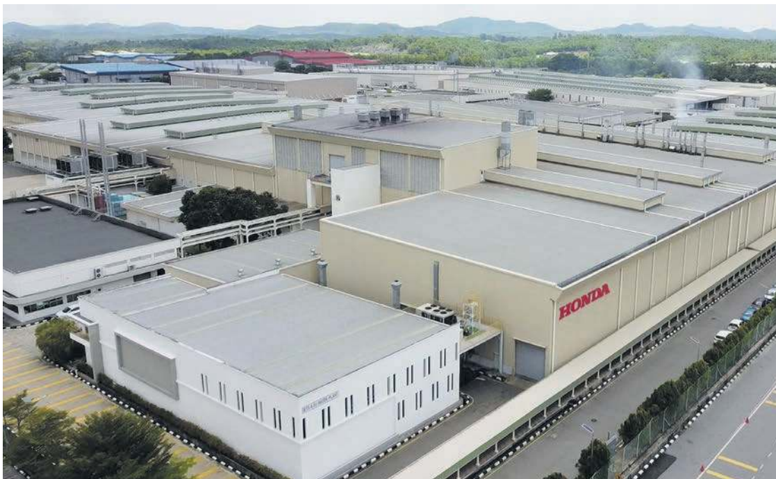
KILANG pemasangan Honda Malaysia di Kawasan Perindustrian HICOM Pegoh.

Kilang tersebut kini memasang tujuh model berbeza membabitkan Honda City, City Hatchback, Civic, Accord, BR-V, HR-V dan CR-V.