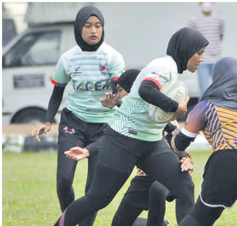
ANTARA aksi yang dipamerkan pemain ragbi wanita dalam Kejohanan Liga Ragbi Melaka di Padang Klebang pada 26 Mac lalu.

"Klinik ragbi wanita diadakan setiap minggu di beberapa lokasi dalam negeri untuk latihan menjelang SUKMA kelak," katanya.