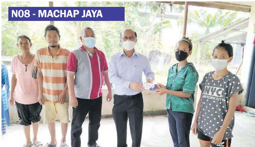
HEE Sem menyampaikan sumbangan kepada keluarga mendiang Papai serta memujuk anak bongsunya untuk kembali ke sekolah.