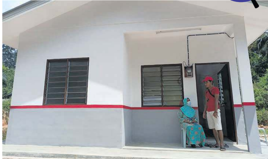
LIMAH dan anaknya bersyukur mendapat rumah baharu.

Malah, kehidupannya itu dijentik lagi apabila terpaksa berdepan dengan ibu bapa yang mempunyai penyakit kronik dan anaknya pula menghidap gangguan Sindrom Kurang Daya Tumpuan dan Hiperaktif (ADHD) memerlukan perbelanjaan rapi bagi melak-