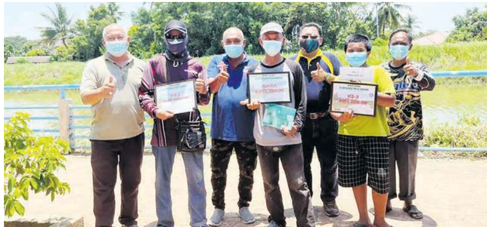
PEMENANG utama pertandingan memancing Joran Darat @Empangan Pulau Gadong, 27 Mac lalu.

KLEBANG - Seorang pemancing terkedu apabila ikan keli seberat 1.58 kilogram (kg) yang dipancingnya di Empangan Pulau Gadong, di sini, melayakkannya membawa pulang wang tunai RM10,000.