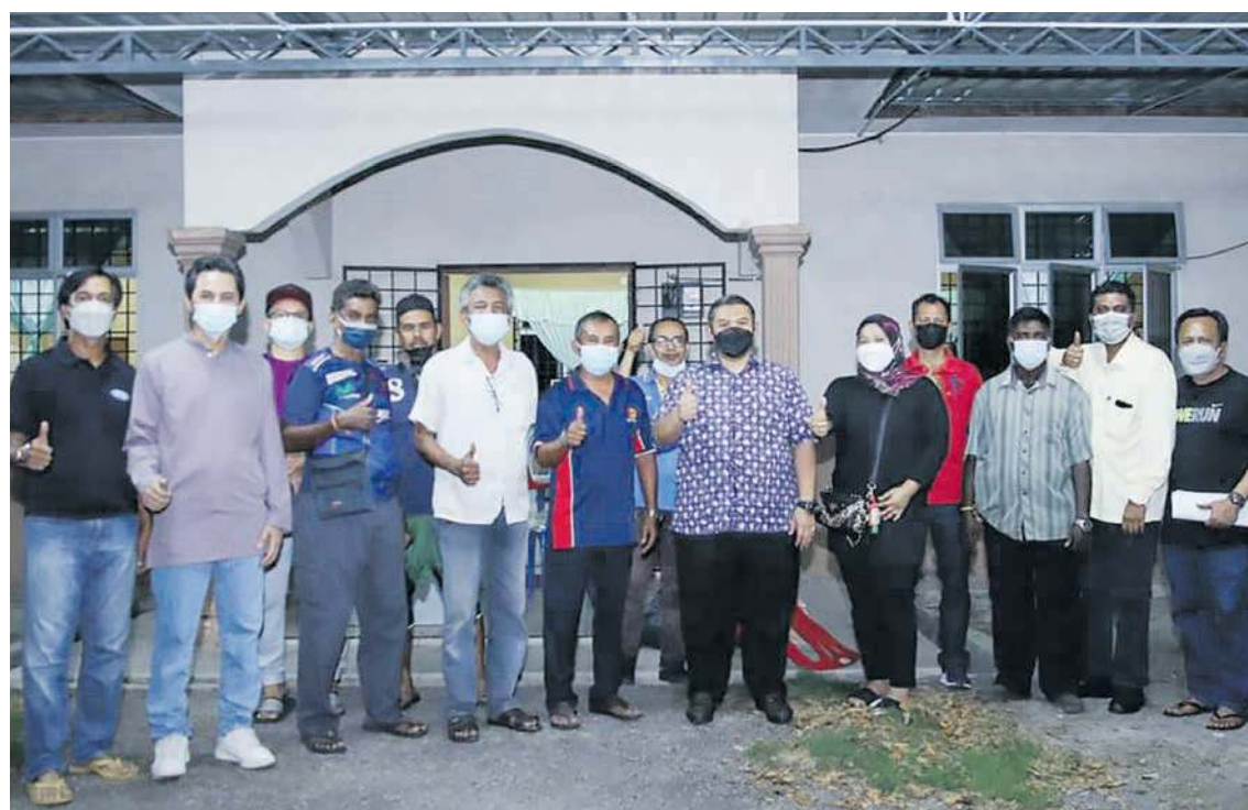
RAIS hadir pada sesi pemilihan dan pelantikan KRT Taman Paya Rumput Indah.

Beliau yang juga EXCO Pendidikan negeri turut menyampaikan peruntukan RM3,000 kepada KRT berkenaan selain menyumbangkan pendingin hawa untuk dipasang di balai raya taman berkenaan.