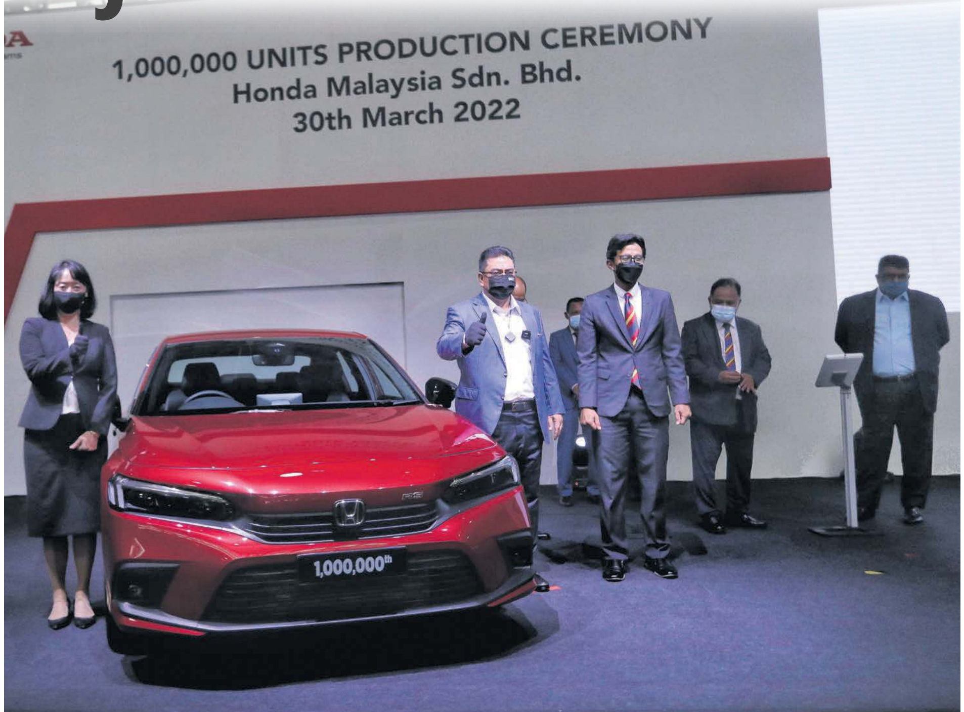
KETUA Menteri Datuk Seri Utama Sulaiman Md Ali bersama kenamaan meraikan kejayaan Honda Malaysia mengeluarkan satu juta unit kenderaan di kilang pemasangannya di Pegoh, Taboh Naning.