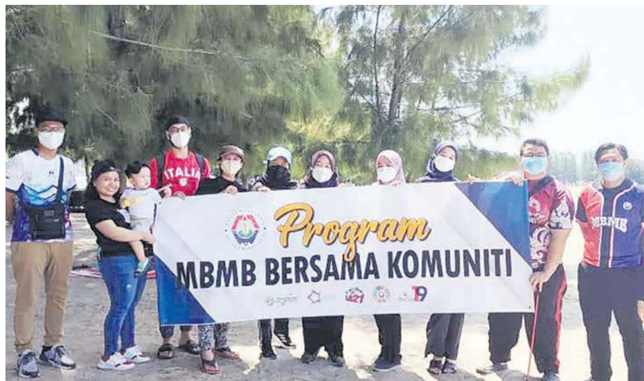
ANTARA pelajar Vision College yang menyertai program CSR di Pantai Klebang.

"MBMB merakamkan ucapan tahniah dan syabas kepada pelajar-pelajar yang mengambil bahagian untuk menjayakan program ini," kata kenyataan itu.