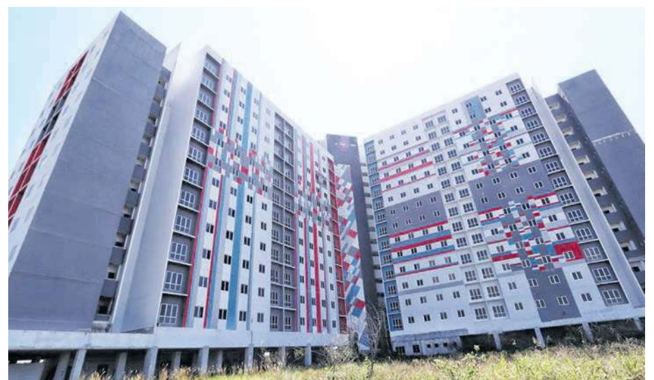
PROJEK pembinaan PPR Klebang yang terbengkalai sejak 2018.

kawasan ini saya hati melihat tiada perkembangan sedang-