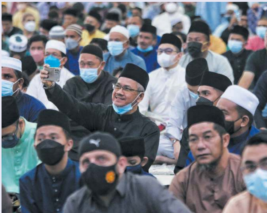
SEORANG jemaah mengambil kesempatan berswafoto ketika menunaikan solat sunat Aidilfitri di Masjid Al-Azim.