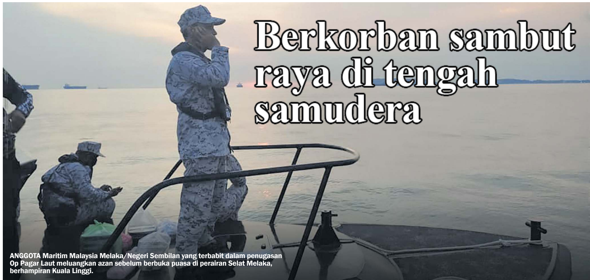
ANGGOTA Maritim Malaysia Melaka/Negeri Sembilan yang terbabit dalam penugasan Op Pagar Laut meluangkan azan sebelum berbuka puasa di perairan Selat Melaka, berhampiran Kuala Linggi.