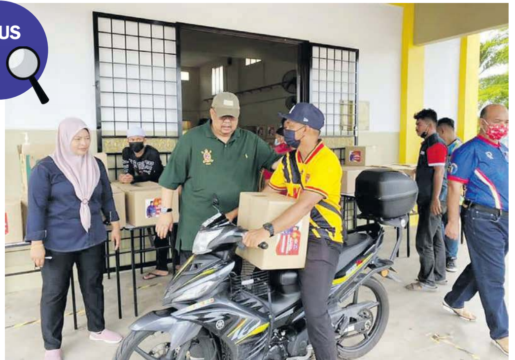
AB Rauf memberikan sumbangan kit makanan kepada keluarga B40 di DUN Tanjung Bidara secara pandu lalu

Ia membabitkan 700 keluarga dari kawasan kampung dan 300 keluarga membabitkan kawasan taman perumahan di DUN Tanjung Bidara.