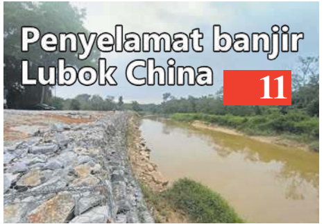
Penyelamat banjir Lubok China 11