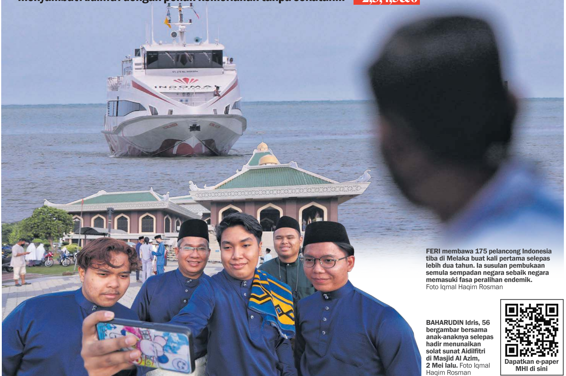
FERI membawa 175 pelancong Indonesia tiba di Melaka buat kali pertama selepas lebih dua tahun. Ia susulan pembukaan semula sempadan negara sebaik negara memasuki fasa peralihan endemik.