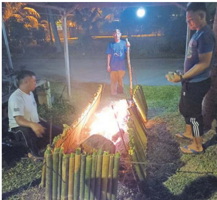
PENIAGA lemang terpaksa berjaga hingga ke pagi bagi menyiapkan tempahan lemang selepas Aidilfitri diumumkan sehari lebih awal.

"Saya banyak terima tempahan daripada peniaga jadi apabila sudah raya mereka tidak berniaga, ada peniaga ambil 40 kilogram (kg) hingga 60 kg untuk meniaga lemang dan dodol," katanya.