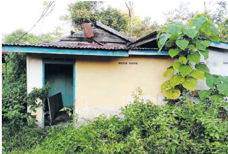
MAYAT lelaki warga emas ditemui dalam rumah pusaka tinggal di Kampung Londang, kelmarin.