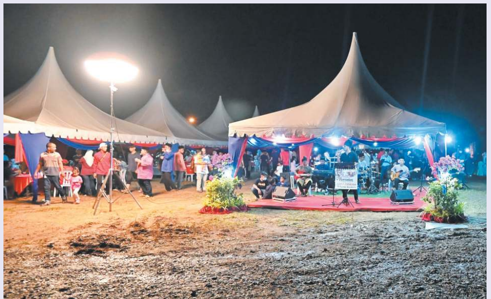
PERSEMBAHAN kugiran menyeronokkan Rumah Terbuka Aidilfitri DUN Ayer Limau.