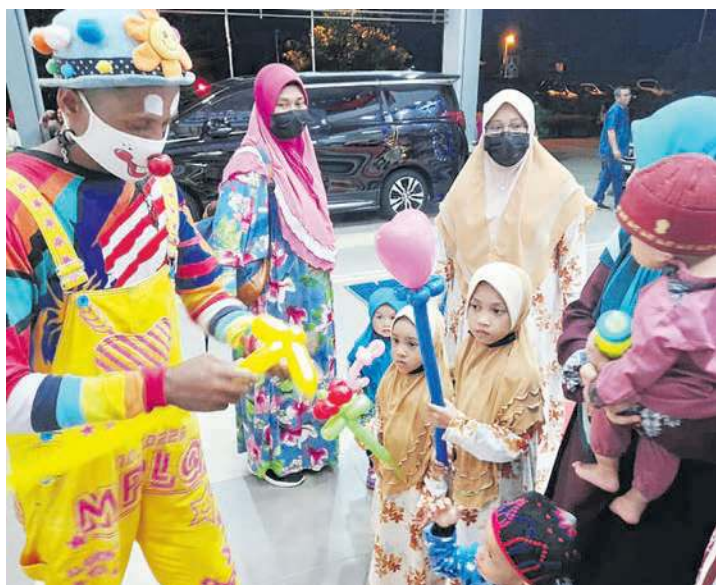
MR Bozo membentuk objek mainan daripada belon untuk yang mencaerikan kanak-kanak.