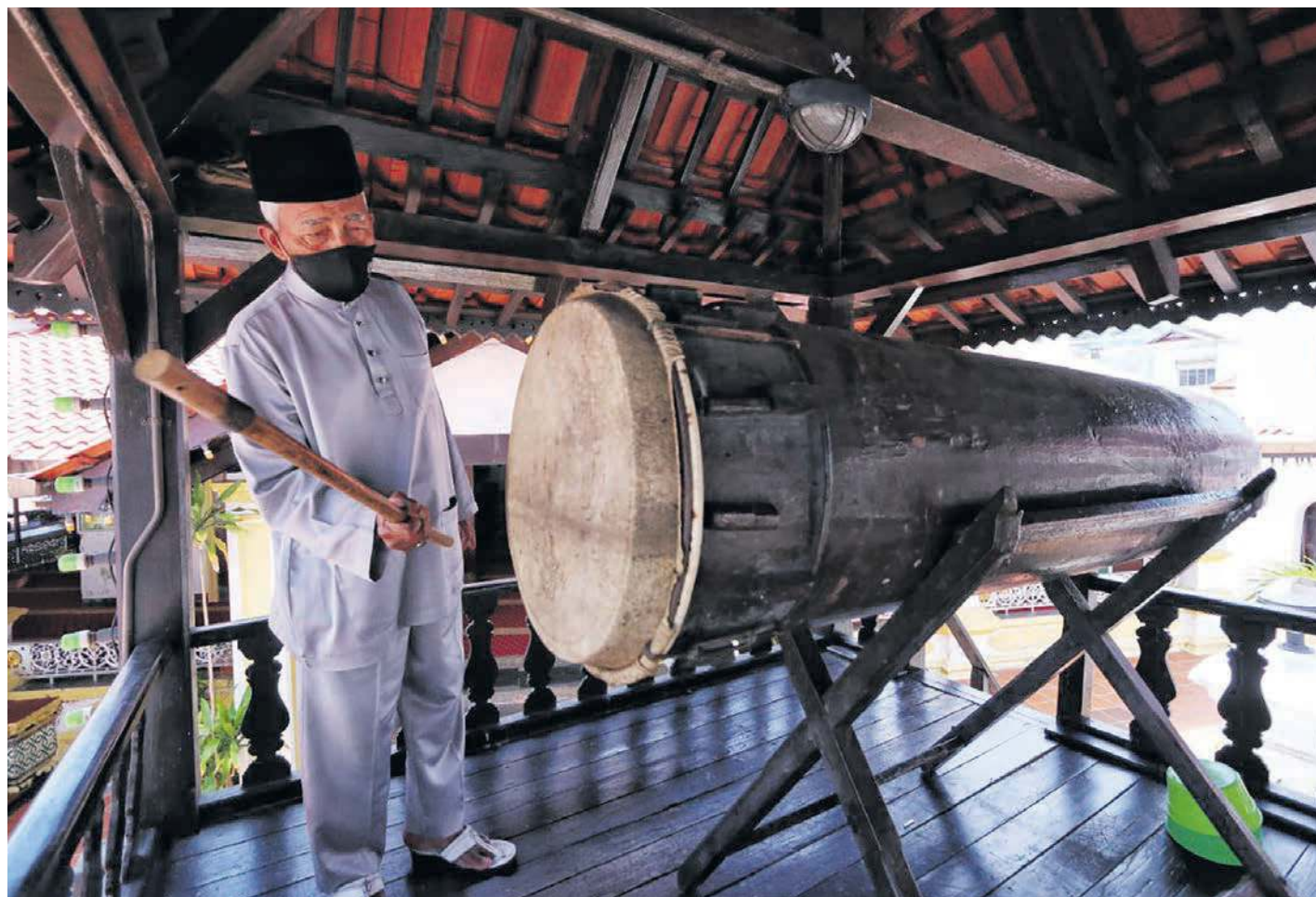
THE beating of the beduk/tabuh also signals the end of fasting for the day and the beginning of breaking fast – the start of drinking and eating.

Linguistics scholar Professor Asmah Haji Omar's Malay Perception of Time (2000/2013) looks at time through the grammatical systems and structures of Bahasa Melayu. These reflect notions of time deriving from a wealth of vocabularies from other languages including Sanskrit, Arabic, and Eng-