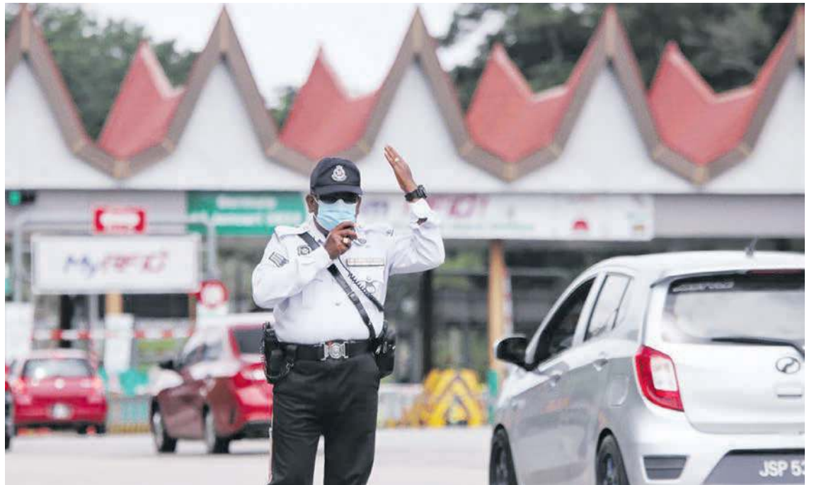
ANGGOTA trafik mengawal aliran lalu lintas pada Op Selamat 18 sempena Hari Raya Aidilfitri di Plaza Tol Simpang Ampat.

Jelasnya, antara kesalahan yang banyak dikesan ialah membabitkan halangan lalu lintas, parkir bertindih dan menggunakan telefon bimbit ketika memandu.