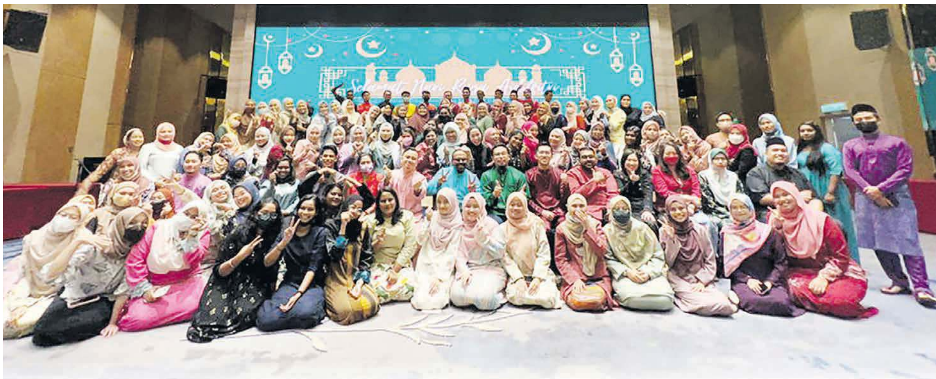
SEBAHAGIAN kakitangan One Medic bergambar bersama selepas Majlis Berbuka Puasa One Medic Health Care Sdn Bhd di Hotel Ames.