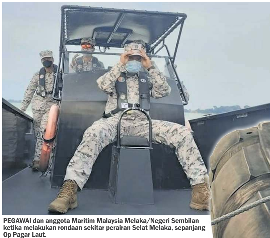
PEGAWAI dan anggota Maritim Malaysia Melaka/Negeri Sembilan ketika melakukan rondaan sekitar perairan Selat Melaka, sepanjang Op Pagar Laut.

Operasi Khas Pagar Laut siri 1/2022 bermula 19 April hingga 17 Mei 2022 di seluruh perairan Malaysia, bertujuan mengekang aktiviti penyeludupan rokok, migran dan membanteras jenayah di laut.