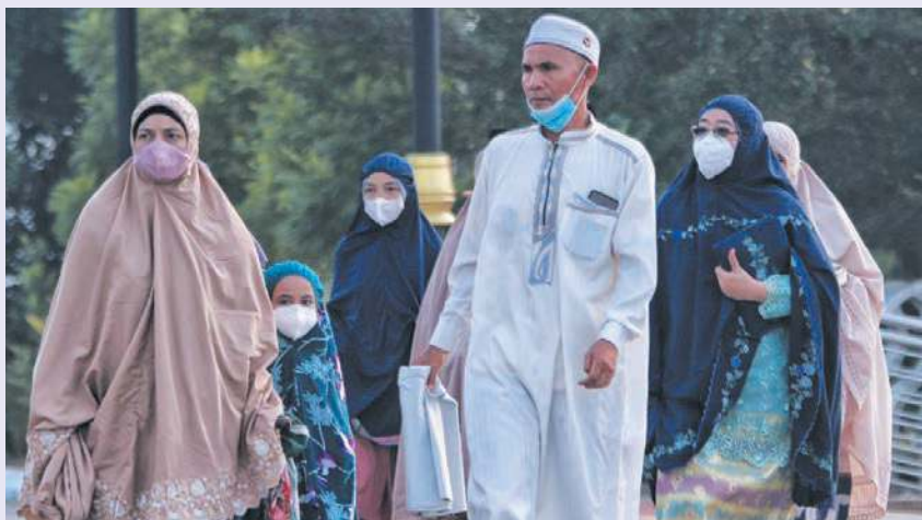
Umat Islam berjalan menuju ke Masjid Al-Azim untuk menunaikan solat sunat Aidilfitri pada 1 Syawal lalu.