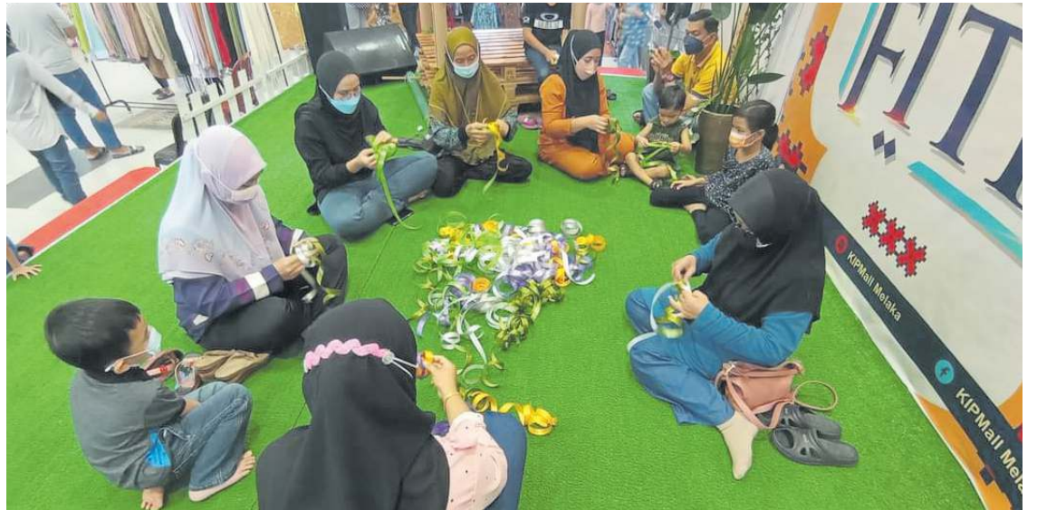
PERTANDINGAN anyam Ketupat antara program mesra komuniti yang dilaksanakan di KipMall Melaka.

"Telah menjadi kebiasaan kami untuk menggembirakan hati serta menghargai setiap komuniti yang hadir melalui program-program