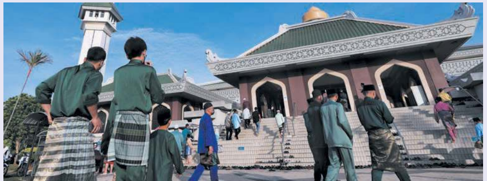
KEMERIAHAN Aidilfitri terasa selepas umat Islam di negara ini dibenarkan menunaikan solat sunat Aidilfitri tanpa sekatan atau penjarakan sosial seperti dua tahun lalu.