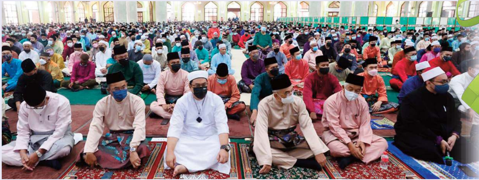
RAKYAT Melaka menunaikan solat sunat Aidilfitri di Masjid Al-Azim bersama Yang di-Pertua Negeri Tun Seri Setia Mohd Ali Mohd Rustam yang diiringi Ketua Menteri Datuk Seri Utama Sulaiman Md Ali.