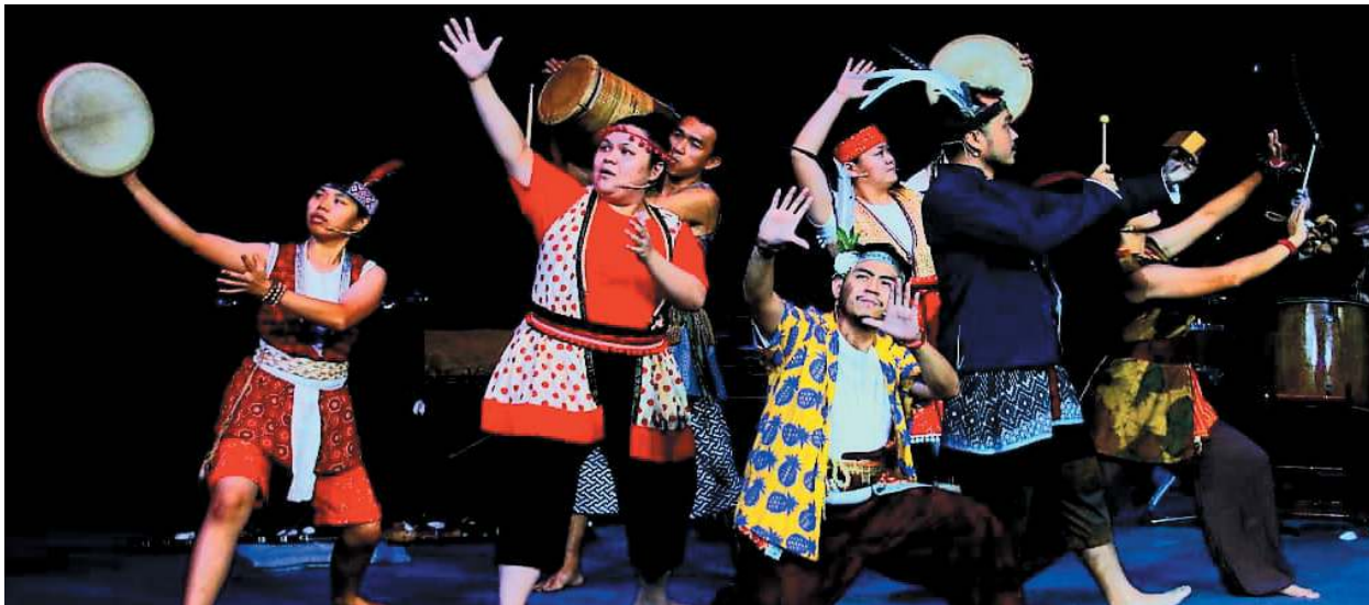
ANTARA pementasan menarik yang dipersembahkan di Encore Melaka sejak ia dibuka kembali 30 April lalu.