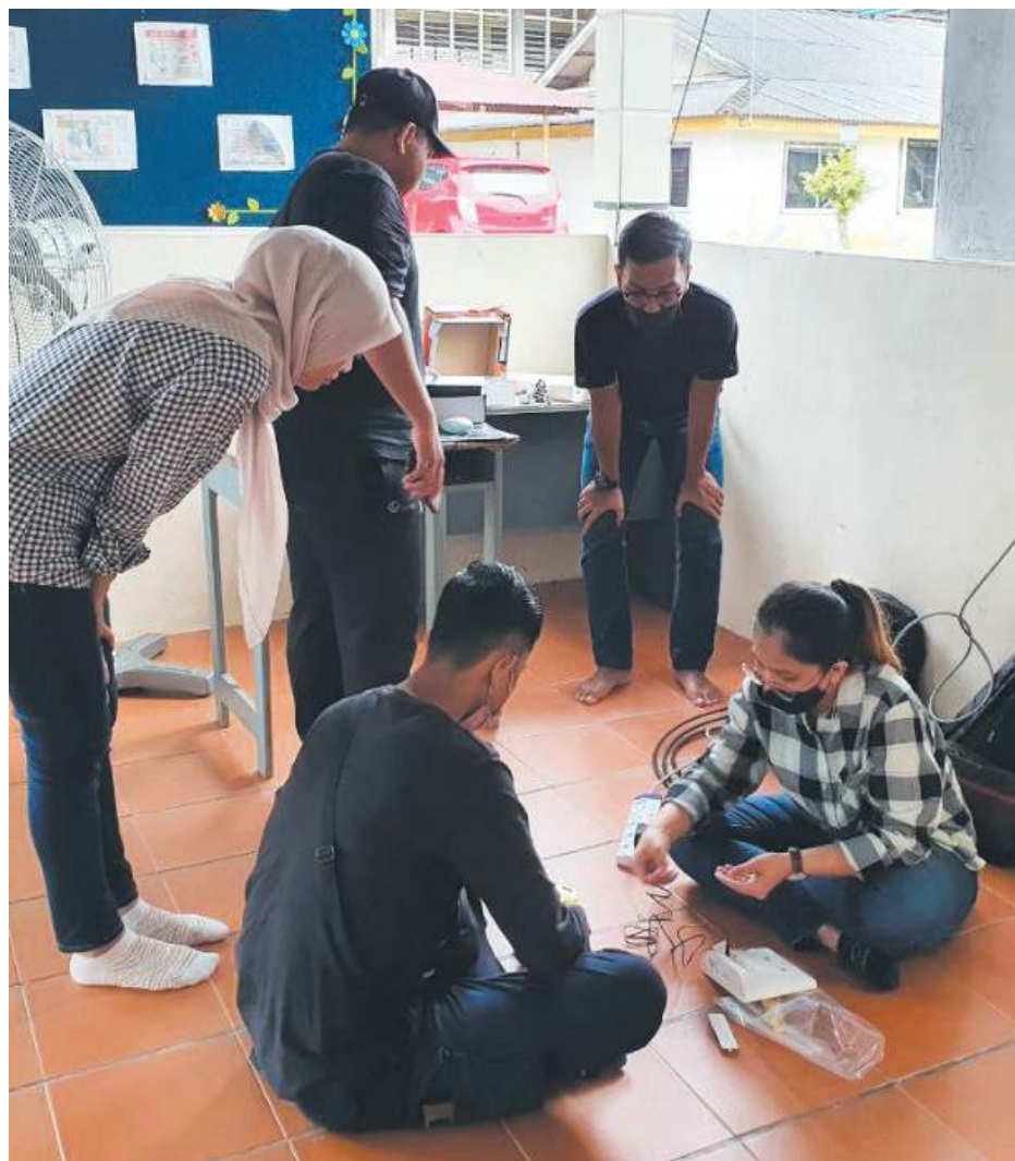
PELAJAR dan pensyarah UTeM ketika melaksanakan kerja pemasangan penghala wayarles beserta antena luaran di Sekolah Menengah Kebangsaan Dang Anum, Merlimau.

Sehubungan itu beliau merakamkan ucapan penghargaan dan terima kasih di atas sumbangan pihak UTeM yang telah berjaya menyempurnakan kerja-kerja pemasangan dari mula hingga selesai.