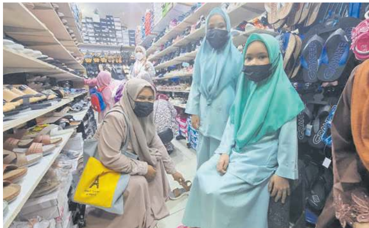
PROGRAM Santuni Kasih yang dilaksanakan pada Ramadan lalu bagi menyantuni anak-anak yatim dan asnaf dalam pemberian kelengkapan pakaian serta kasut bagi menyambut Hari Raya Aidilfitri.

mesra komuniti dan kita akan terus komited melayani komuniti yang hadir disini.