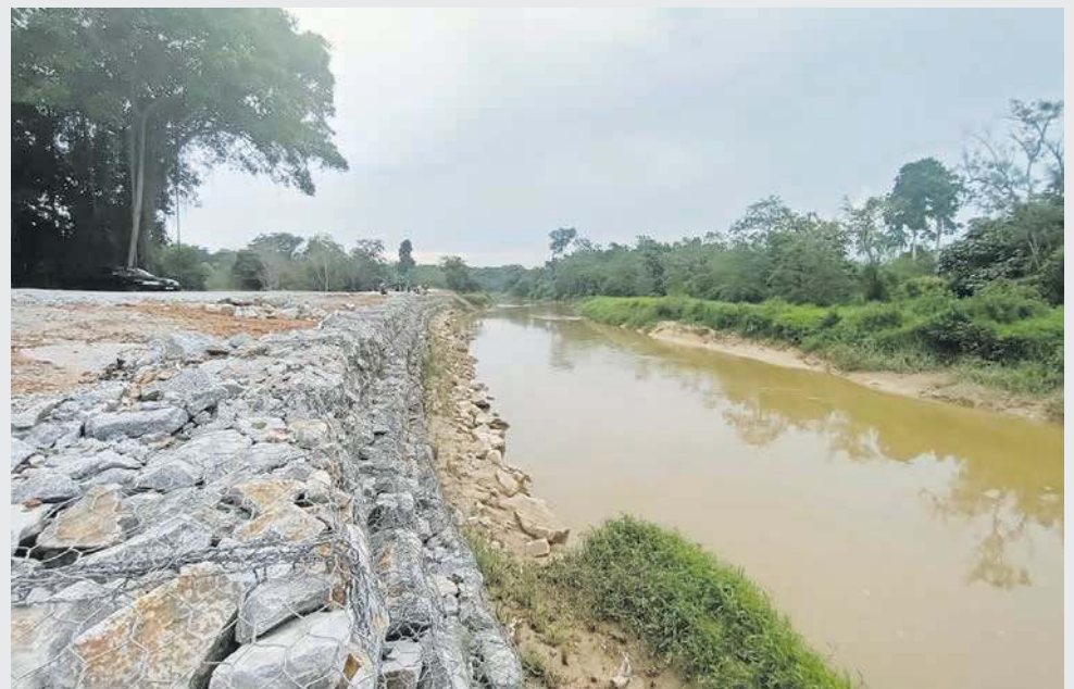
BAN yang menelan peruntukan lebih RM500,000 telah siap dibina di sebatang sungai berdekatan Taman Wira Indah mampu mengatasi isu banjir yang berlaku di Lubok China.

"Kita akan membina pula lagi satu ban di Sungai Spout dalam masa terdekat ini di mana setakat ini kita masih dalam proses penawaran sebut harga sedang dilaksanakan menerusi kelolaan Jabatan Pengairan dan Saliran (JPS) Melaka," katanya.